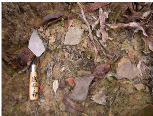
圖說：地表採集的夾砂灰黑陶