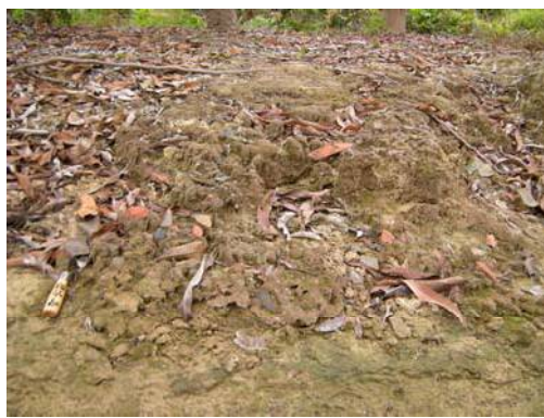
圖說：果園邊坡散落夾砂灰黑陶